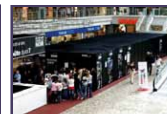
Restaurant " Dans le noir ? ", Galerie Balaxert, Genève 2008.