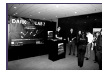
Dark Lab, atelier goût, Tour Areva La Defense, 2008.