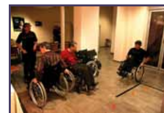
Parcours Fauteuil, Crédit Agricole Lille 2008.

Ethik Event couvre aujourd'hui un spectre très large de sujets allant de la mise en place d'animations expérientielles autour de tous les handicaps (ateliers dans le noir, braille, LSF, parcours fauteuil, malvoyance, handisport...) à l'environnement en passant par le tourisme responsable.