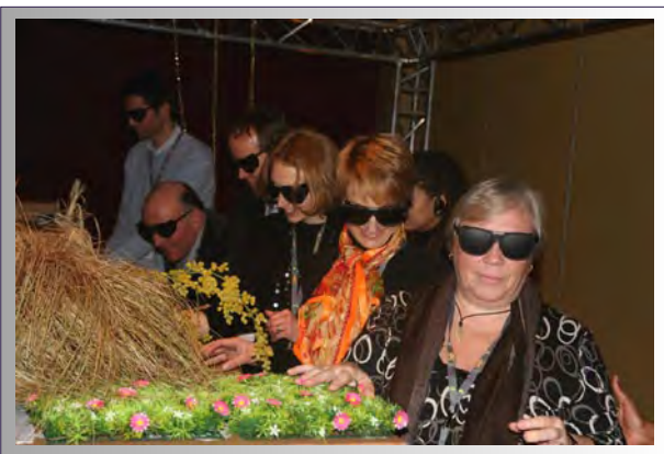
Création d'un dispositif complet de cinq ateliers autour des cinq sens, qui intégraient chacun une différence dans le cadre de la convention des 150 référents handicaps du groupe AREVA, Hôtel Mercure Marseille, 2009