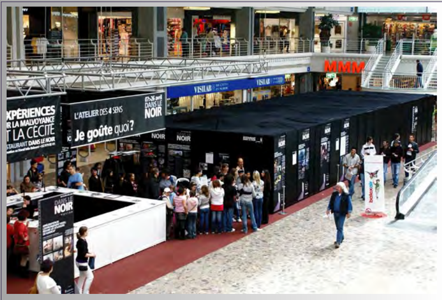
Dark Lab, galerie commerciale Ballexert à Genève pour l'Association pour le Bien des Aveugles de Genève et l'agence de communication suisse CSM, 2008

Le Dark Lab est un laboratoire du noir, complètement mobile. Adaptable et modulable à volonté, il se plie à toutes les demandes. Le Dark Lab peut être installé au cœur des entreprises, des salons et des événements les plus divers, pour un effet toujours spectaculaire.