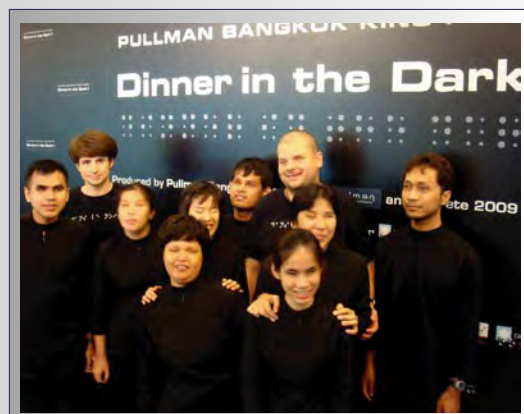
Mise en place d'un restaurant Dans le noir ? pour l'Ambassade de France et l'Hôtel Pullman Bangkok King Power lors du festival "La Fête" Bangkok, Thaïlande, Juin 2009.