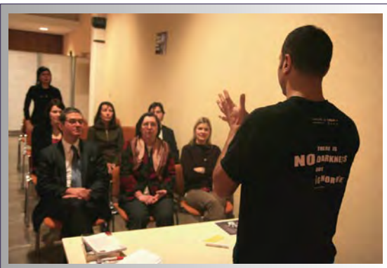
Actions sensibilisations pendant la semaine pour l'emploi des personnes handicapées. Animations gustatives dans le noir et ateliers de sensibilisation au Braille, à la LSF et aux fauteuils roulants. Tournée sites Crédit Agricole : Vannes, Quimper, Lille, Arras, Dijon Lyon, Macon. 2007, 2008

Autour du Dark Lab, Ethik Event propose un dispositif complet de sensibilisation multi-handicaps.