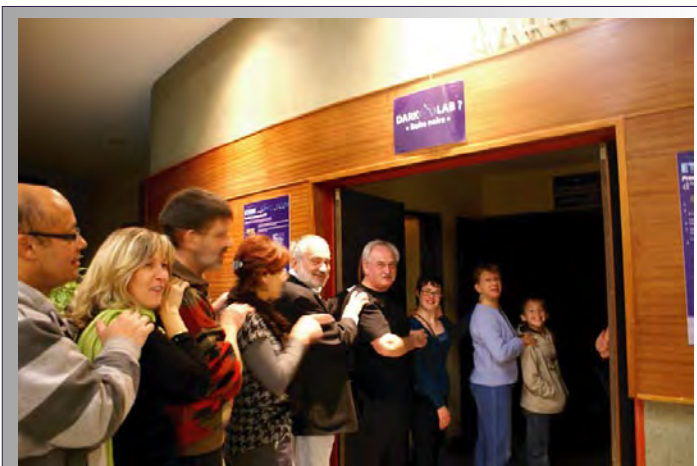
Création d'un événement au cœur de la ville de Genevilliers avec un dispositif complet permettant d'accueillir pendant toute une semaine tout type de public (scolaires, habitants et élus), Genevilliers, 2008

Chaque atelier est animé par des experts handicapés spécialement recrutés et formés en fonction des besoins.