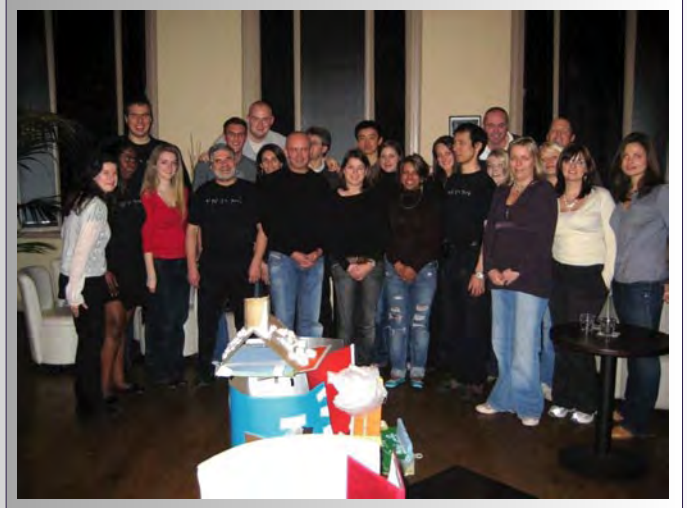
Construction d'un ouvrage commun dans le noir absolu pour les équipes commerciales de la société anglaise Pure, restaurant Dans le Noir ?, Londres, 2008

Constructions, débats ou conférences dans le noir...solicitez nos équipes pour concevoir avec vous l'opération la plus adaptée à vos objectifs.