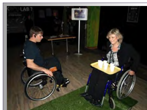
Création du programme « Handi'cap, cap vers l'autrement capable... », Parc Astérix, 2009